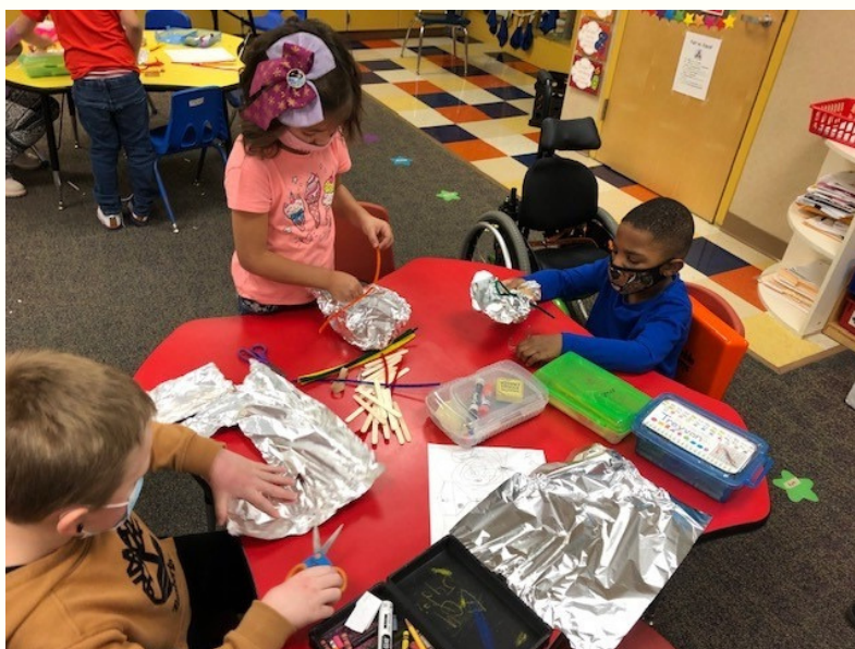
Niños de kindergarten en Miller Elementary usando la Acción Positiva del trabajo en equipo para construir un bote.

LSC's Director of Social and Emotional Learning kgparthun@lsc.k12.in.us